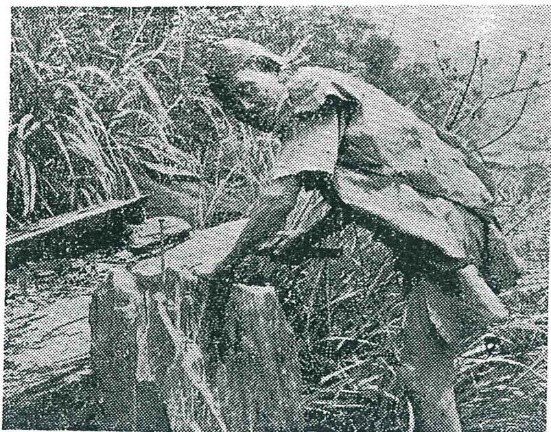
道走做版石鑿光聖為會教地山鄉台霧

聖光聖經學院成立迄今，不過短短十年，可是你知道嗎？建立這樣的訓練培育上帝僕人的機構早已有悠久的歷史了。在舊約時代，先知們會招收門徒並教訓他們，使他們領導百姓認識上帝，並在百姓背道和靈性墮落的時候，引領全國復興。